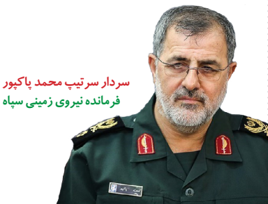
سردار سرتیپ محمد پاکپور فرمانده نیروی زمینی سپاه

در لحظات پرمجاری که جهانیان شاهد پیروزی‌های راهبردی و افتخارآمیز رزمندگان اسلام تحت بیرق مقاومت زینی در سرزمین شام هستند، سرداری سرفراز و فرماندهای مجاهد و دلور از تربیت یافتگان ولایت فقیه و انقلاب اسلامی به قافله شهیدان همیشه جاوید اسلام عزیز پیوست.