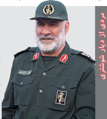
مردی از دیار شوشتری

هر دو از اهالی نیشابور بودند. نام یکی نورعلی و نام دیگری محسن. ظاهر و اخلاقشان هم به هم شبیه بود. شهید قاجاریان وصیت کرده بود که اگر شهید شدم من را در جوار یادمان شهید شوشتری دفن کنید. شهید شوشتری از فرماندهان قرارگاه نجف در دوران دفاع مقدس بود. شهید قاجاریان در سال‌های جنگ درس‌های بسیاری از او آموخته بود و گرچه به لحاظ سازمانی فرمانده مستقیمش نبود اما خود را سرباز شهید شوشتری می‌دانست.