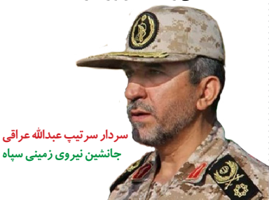
سردار سرتیپ عبدالله عراقی جانشین نیروی زمینی سپاه

سردار شهید قاجاریان از رزمندگان با تقوا و خوش سابقه‌ای بود که تجربیات گرانسنگی را از دوران دفاع مقدس اندوخته بود و در صحنه مبارزه با تکفیری‌ها تلفات سنگینی را به دشمن وارد کرد.