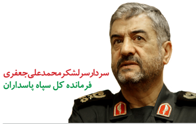
سردار سرلشکر محمدعلی جمفری فرمانده کل سپاه پاسداران

ماجرای شهادت و داوطلب بودن برای تقدیم جان در راه اسلام و انقلاب اسلامی ماجرای طولانی است اما نکته مهم این است که در هر مقطع انقلاب، شهیدان با آمادگی برای جانفشانی، خون تازه‌ای در مقاومت اسلامی جاری کردند و باعث پیشبرد اهداف انقلاب اسلامی شدند.